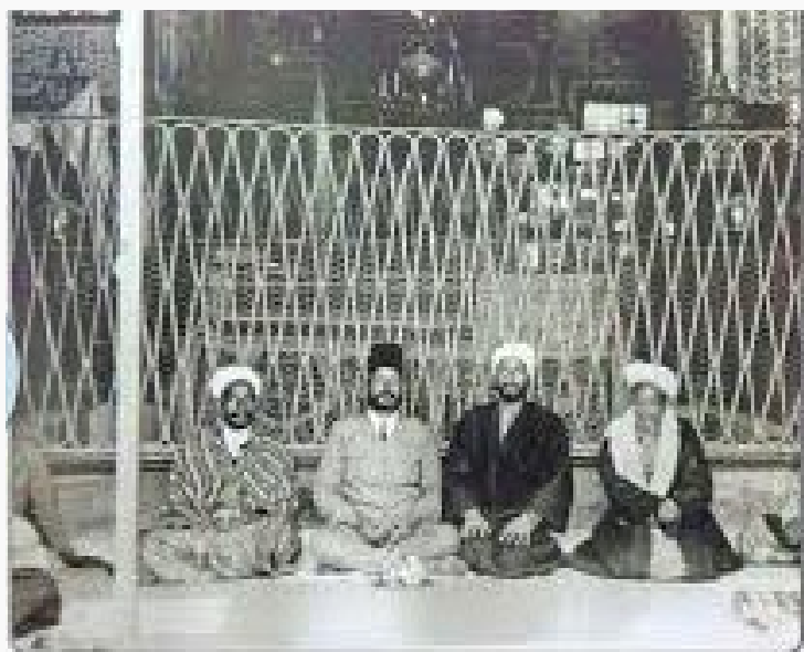
قبر و شريح سيدنا الحمزة عم النبي عليهم السلام قبل الهدم من قبل الوهابية - هذه الصورة عام ١٩٠٤م