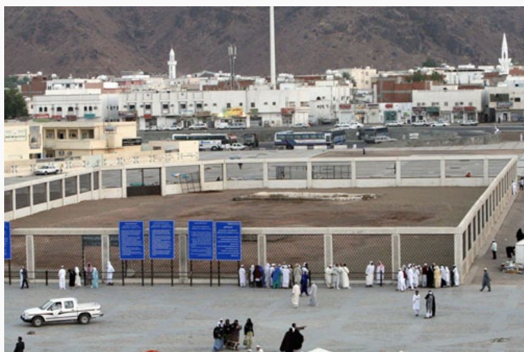
مقبرة حمزة وشهداء أحد بعد الهدم على يد الوهابية