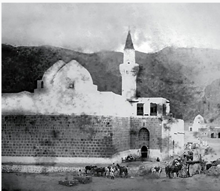
مقبرة حمزة وشهداء أحد قبل الهدم على يد الوهابية