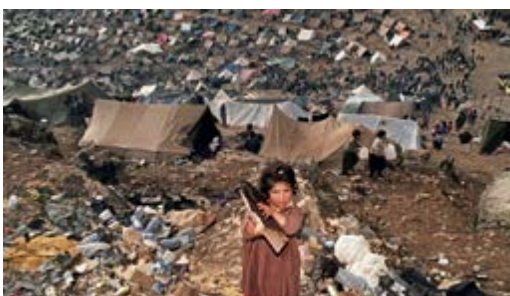
نزوح الاكراد، اثناء قمع الانتفاضة الشعبانية