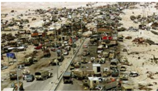
دمار العراق بعد حرب الخليج الثانية