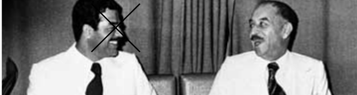
عبد الكريم قاسم

العراقية وبخاصة الحلة واعتقلت السلطات الشيخ محمد سماكة امام المسجد الكبير في المدينة وكانت في وقتها متصرف لواء الحلة ناجي شوكت.