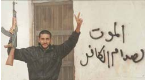
الانتفاضة العراقية (الشعبانية) سنة ١٩٩١م