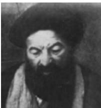
السيد اليزدي (رض)

تبنت المرجعية الدينية العليا (السيد كاظم اليزدي (رض)) في ١١/٢٩/١٩١٤م الجهاد ضد بريطانيا