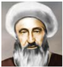
الميرزا النجيني (رض)