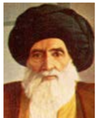
السيد ابو الحسن الاصفهاني (رض)

مجرانا من خدام الدين... ان جميع المسلمين اخوان تجمعهم كلمة الاسلام وراية القرآن الكريم والنبي الاكرم صلى الله عليه واله (وصحبه.).