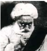
الشيخ محمد تقي الشيرازي (رض)