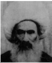
شيخ الشريعة (رض)